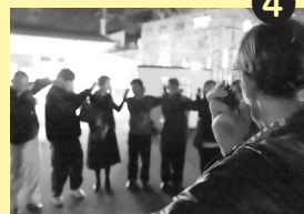
④隣の人にだけ聞こえるささやかな音で松ぼっくりをはじいて音を出します。作曲家ならではの視点でのユニークな音風景をめぐるツアーでした。