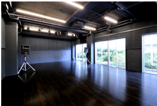
スタジオ 1 / Studio 1