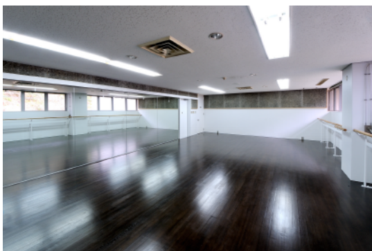
スタジオ 4 / Studio 4