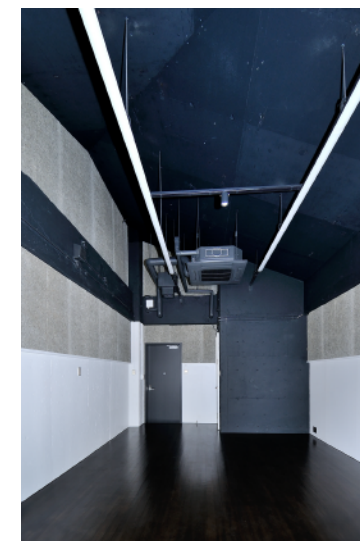
スタジオ 6 Studio 6