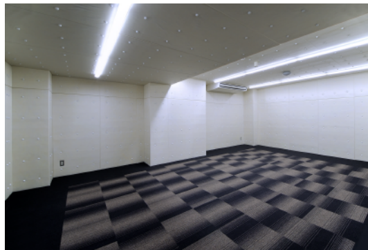
スタジオ 2 / Studio 2