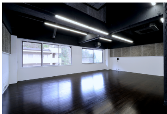
スタジオ 5 / Studio 5